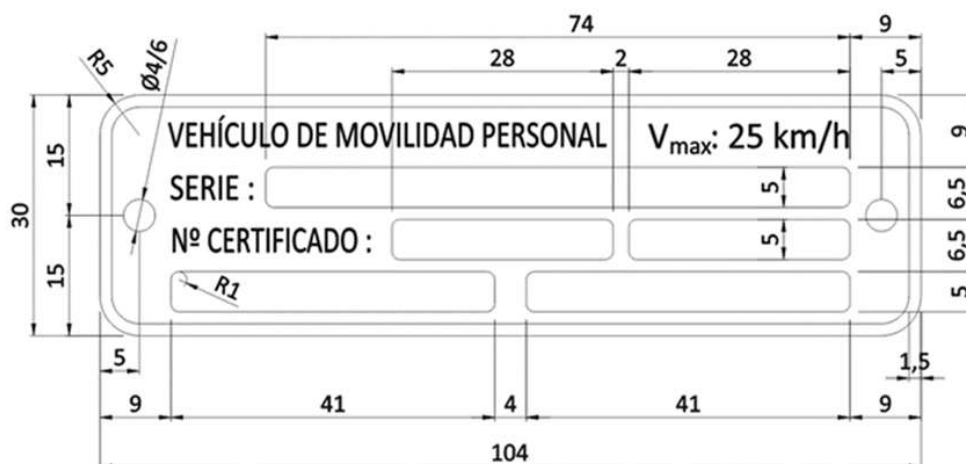
Imagen 3: Tamaños del marcaje de VMP

La impresión de los textos de la placa de marcaje será del color de fondo del aluminio y se utilizará la técnica del láser. El estilo de letra será Arial negrita, con una altura no superior a los 4 mm y con una tolerancia de \pm 0,5 mm en la de los caracteres a inscribir. La placa de marcaje irá sujeta mediante remaches, no admitiéndose una sujeción mediante tornillos o adhesivos.