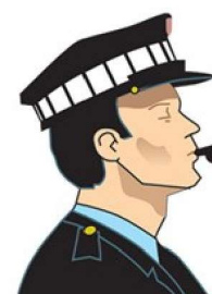
Señales hechas con silbato