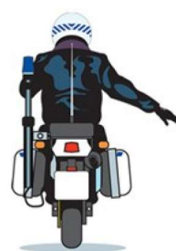
Brazo extendido hacia abajo inclinado y fijo