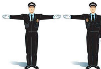
Brazo o brazos extendidos horizontalmente