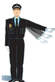
Brazo extendido moviéndolo alternativamente de arriba a abajo