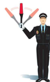
Balanceo de una luz roja o amarilla