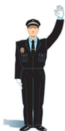
Brazo levantado verticalmente