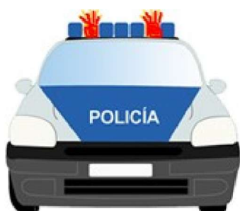
Luz roja intermitente o destellante hacia adelante